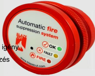
A műszerfalra szerelt riasztópanel (50mm)

A BlazeCut busz tűzjelző első lépésként használható biztonsági megoldásként, hogy figyelmeztesse a járművezetőt és az utasokat a tűzre. Kizárólag figyelmeztető rendszerként a kompakt CAP200 50 mm-es riasztópanelünket használja BlazeWire lineáris hőérzékelővel a motortér és az elektromos területek tűzveszélyes állapotának ellenőrzésére. Vagy olyan hibáknál, amelyeknél a hőmérséklet az elfogadható szint fölé emelkedhet.